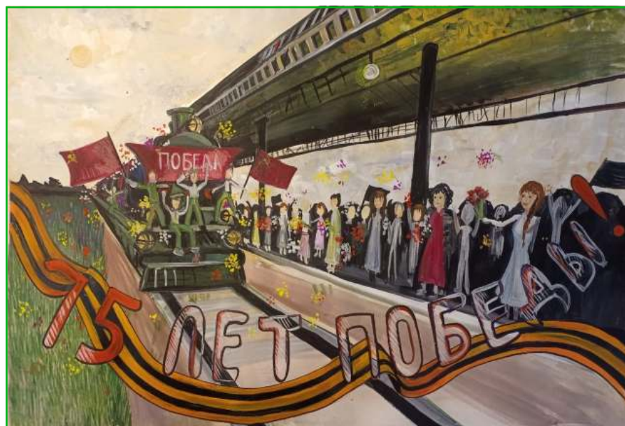
9 «В» сыйныф укучысы ФАТТАХОВА Альмираның рәсеме