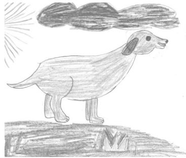
Рисунки Хакимовой Рамили