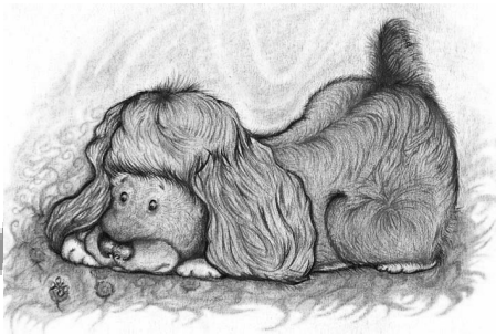
Рисунок Багаутдиновой Медины