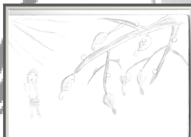
«Капель» Л. Карлиева