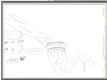
«Капель» М. Цой