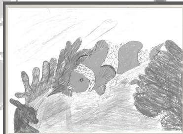
«Подводный мир» Р. Марданов